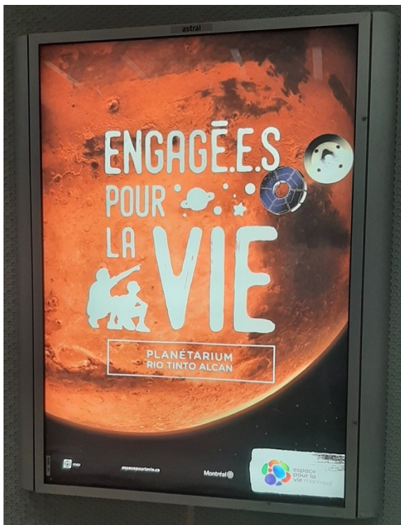
Figure C.1 Campagne publicitaire de l'Espace pour la vie de Montréal (domaine public, photographie prise le 21 janvier 2022)